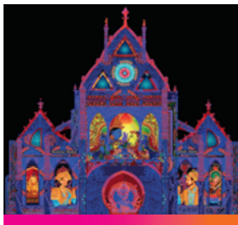
M RAGA PĪLŌ ΑΠΟΥΣΗΚΑ ΣΗΑΠΚΑΡ ET PATRICIA ΚΟΡΑΤΧΙΝΣΚΑΪΑ (TRADITIONNEL)