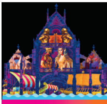
M FOG OVERTURE BERNARD HERMANN