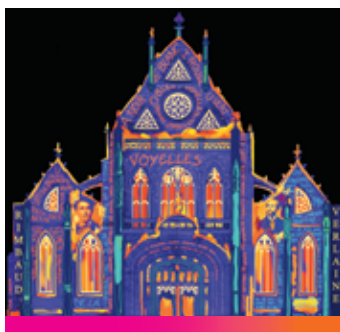
M MYSTERY OF LOVE SUFJAN STEVENS