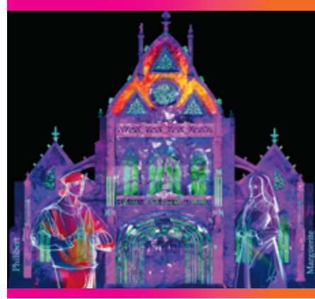
© VISUEL : ART GRAFIK • JEAN PHILIBERT.COM / MISE EN PAGE : WWW.ALBATROBENTIL.COM / NE PAS JETER SUR LA VOIE PUBLIQUE

Le spectacle se termine par l'éternel couple de Brou, Marguerite et Philibert dont le destin est gravé dans le marbre et l'albâtre. Comme un feu d'artifice, les initiales P&M, symbole de leur amour, embrasent le monument.